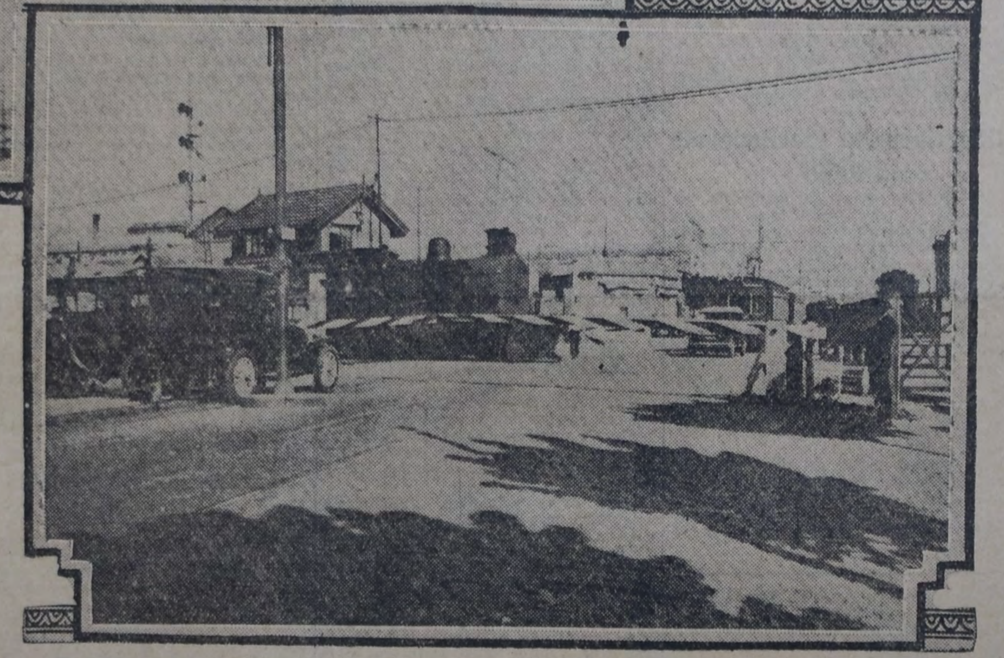
PASO A NIVEL EN RIVERA AL 1200

Completando la nota que publicamos en nuestro número del 17 del corriente, agregamos hoy las presentes notas gráficas demostrativas de los inconvenientes que ocasiona al tráfico de vehículos y peatones el mantenimiento de los pasos a nivel dentro de la ciudad. La representación socialista ocupóse ya de este problema y sus proyectos duermen en las carpetas de la comisión. El público, que experimenta las molestias ocasionadas por este atrasado sistema, exterioriza de vez en cuando su protesta en forma ruidosa, justificada, por cierto, porque generalmente se trata de gente de trabajo